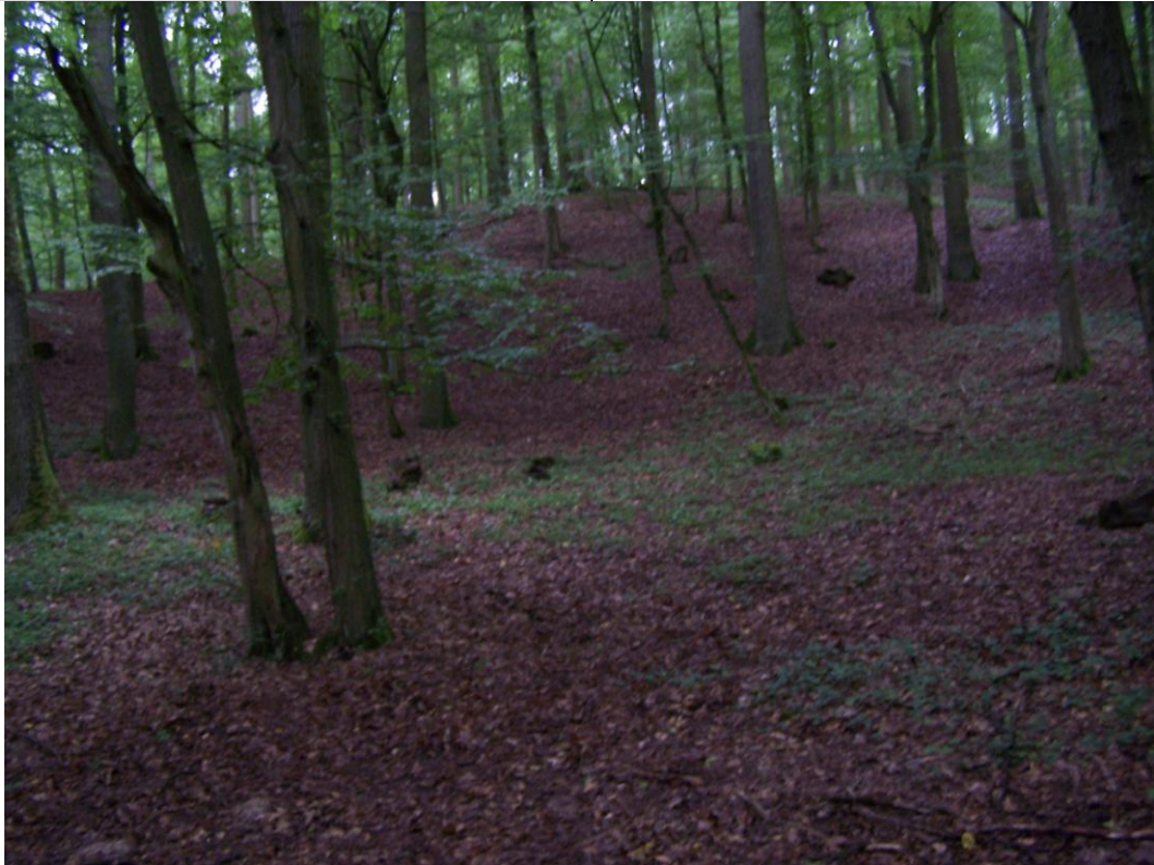
Widok na fragment osuwiska.