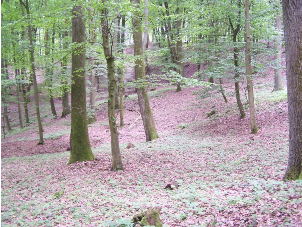
Widok na fragment osuwiska.