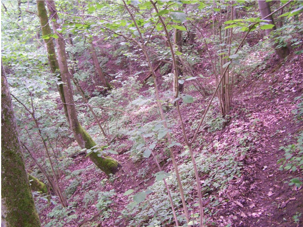
Widok ogólny na osuwisko.