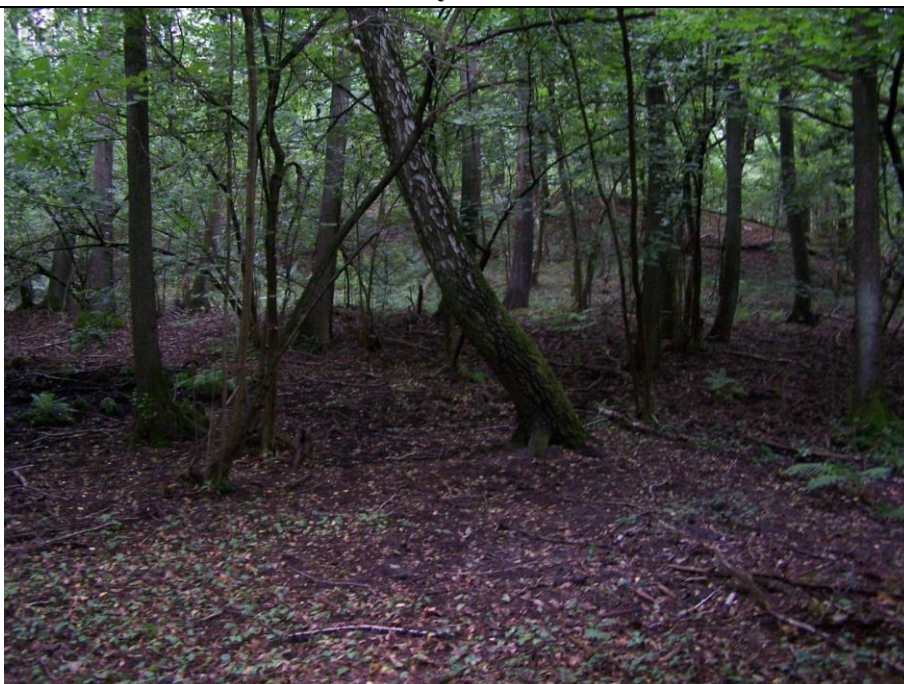
Dolna część osuwiska