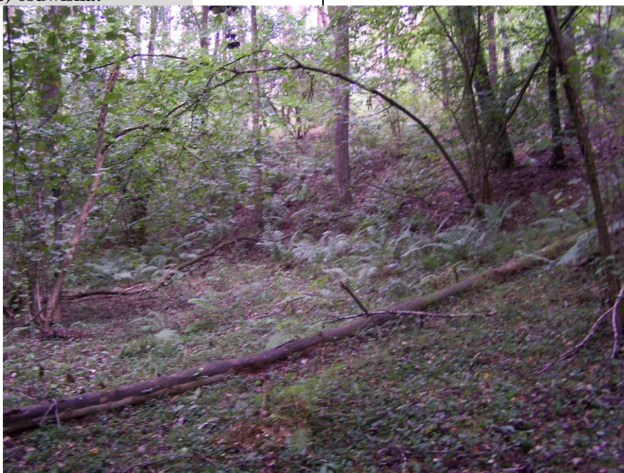
Górna część osuwiska.