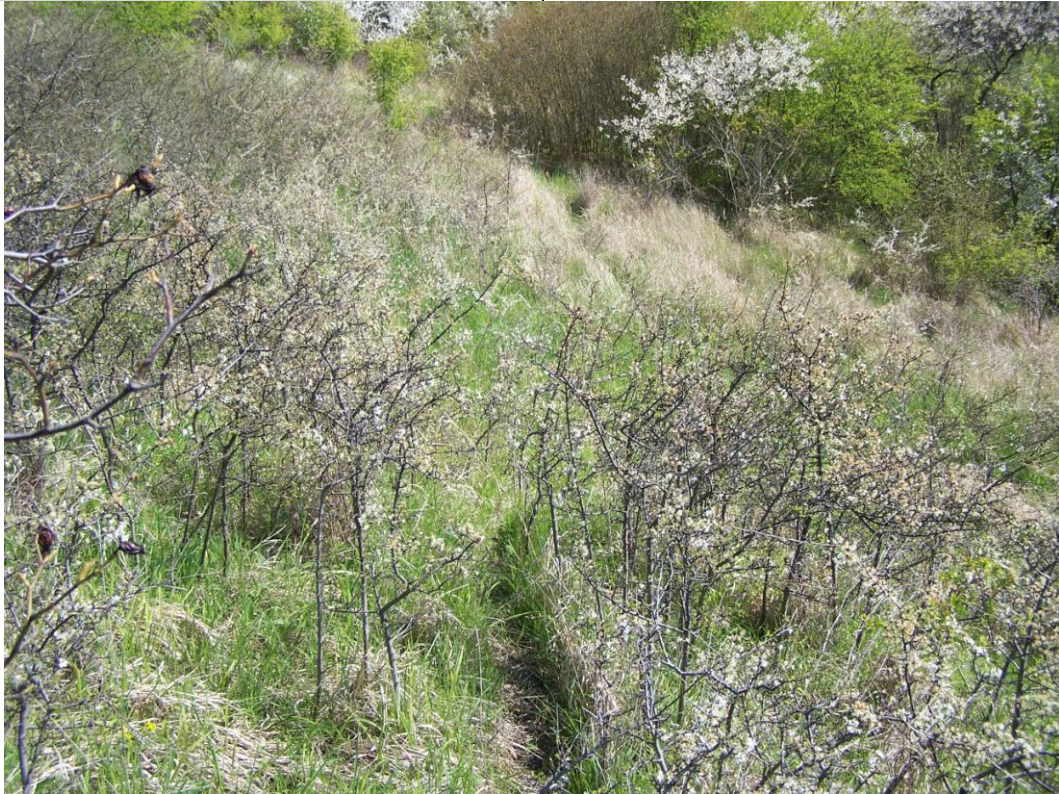
Widok na fragment osuwiska.