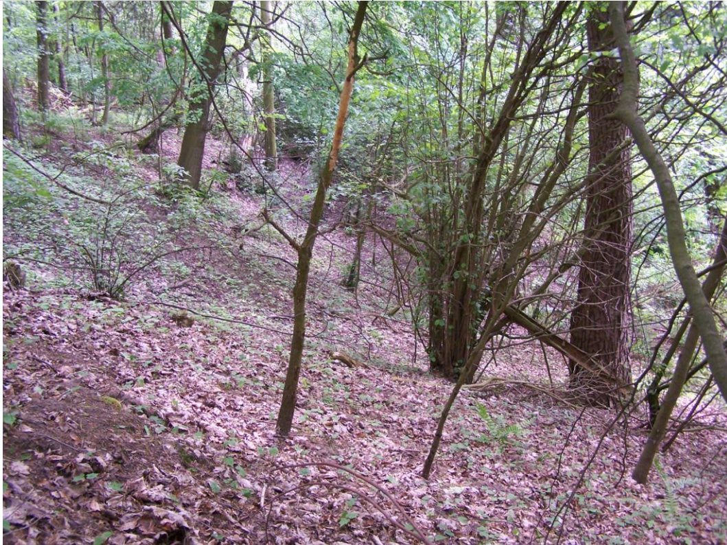
Widok na fragment osuwiska.