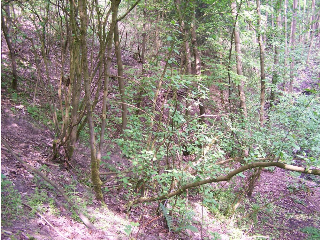
Widok na fragment osuwiska.