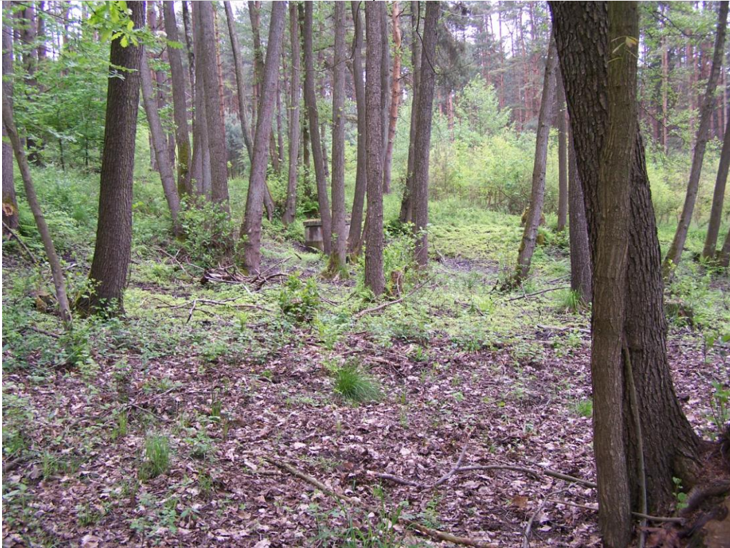
Widok ogólny na dolną część osuwiska.