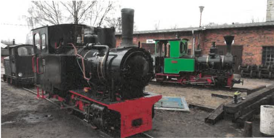
Wyrzyńska Kolejka Powiatowa

względem 2017 roku, spadły o ponad 20%. Najważniejsze inwestycje dotyczyły modernizacji ulic, budowy chodników oraz ścieżek rowerowych, co finalnie powinno przełożyć się na wyższą jakość przemieszczania się po drogach powiatowych.