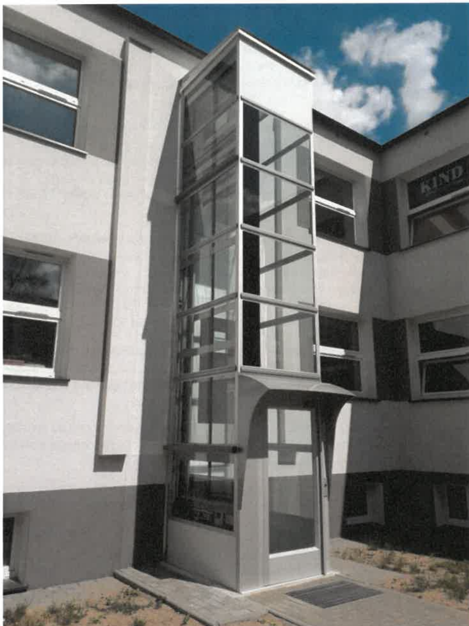
Tabela 16. Działalność Wydziału Nieruchomości w 2018 roku

Budowa pionowej platformy dla osób niepełnosprawnych montowanej na fasadzie budynku położonego w Pile przy Al. Wojska Polskiego 49 B