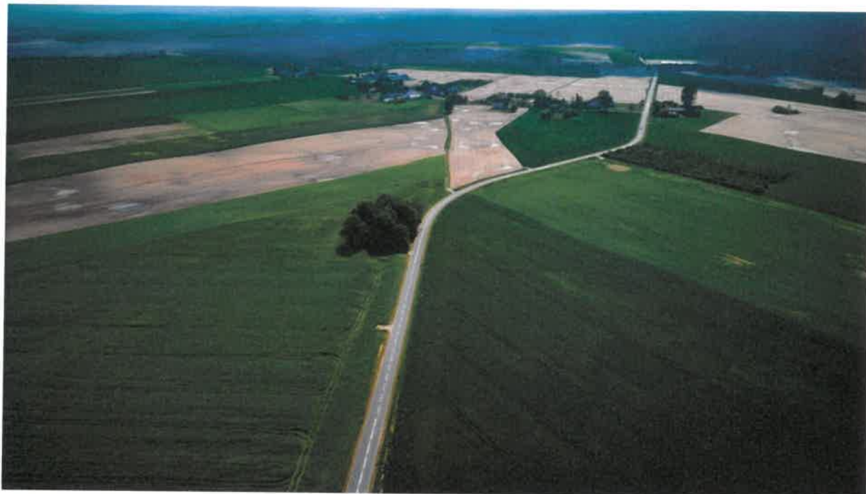
Przebudowa drogi powiatowej nr 1197P na odcinku Kruszki-Kijaszkowo

Podobnie jak we wcześniejszych latach, w trakcie 2018 roku Powiat odpowiadał za bieżące utrzymanie dróg powiatowych. Podstawowe działania w tym obszarze polegały na: