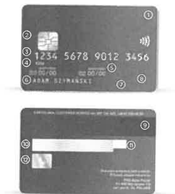
Przykładowa karta chipowa z mikroprocesorem

Karty płatnicze najczęściej są wykonane z plastiku i mają kształt prostokąta o wymiarach 54 na 86 mm. Coraz częściej spotyka się też inne instrumenty płatnicze, które nie muszą być w postaci karty – breloczki, zegarki czy telefony wykorzystujące technologię zbliżeniową. Na kartach płatniczych znajduje się podpis posiadacza karty, a czasem nawet jego zdjęcie. Niepodpisana przez posiadacza karta jest nieważna.